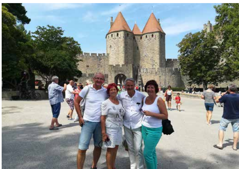
A Carcassonne, le monument de l'UNESCO