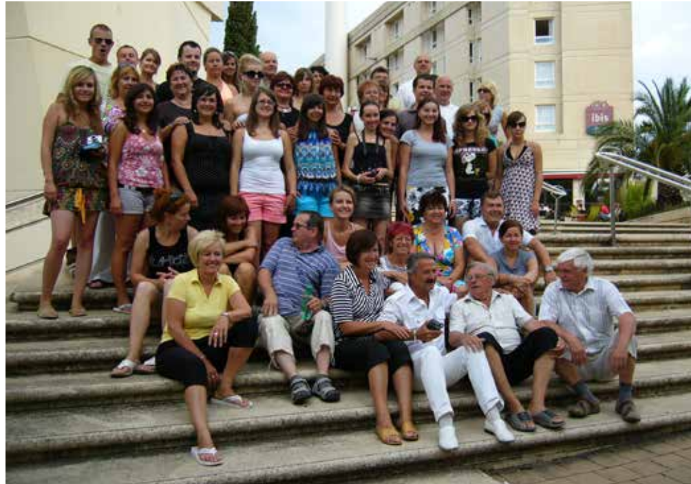
A Montpellier en rentrant des Pyrénées