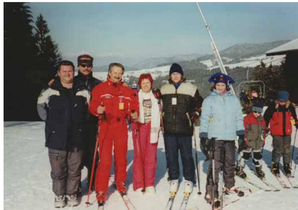
La piste de Čičmany