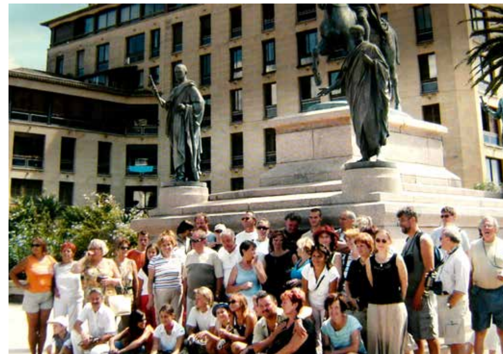
A Ajaccio en Corse devant la statue de Napoléon premier