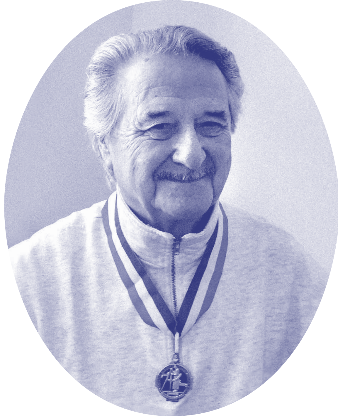
Détenteur de la médaille Le meilleur ouvrier en France en 1982