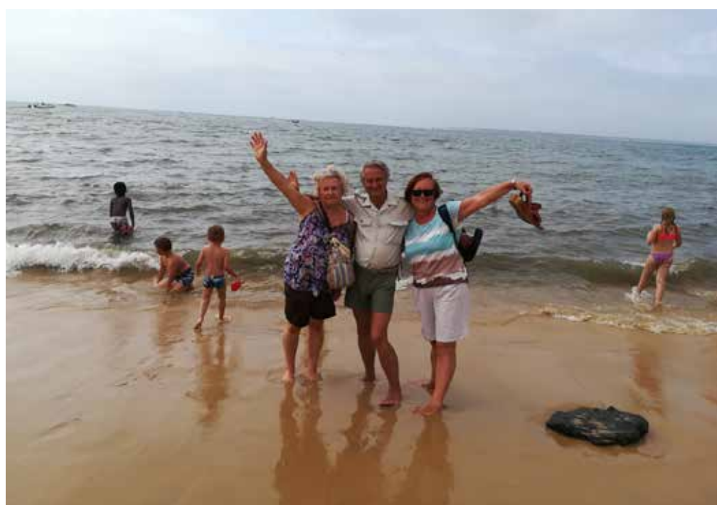
Dune du Pilat