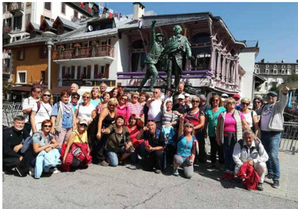
A Chamonix, près de la statue des deux hommes qui sont montés les premiers sur le Mont Blanc