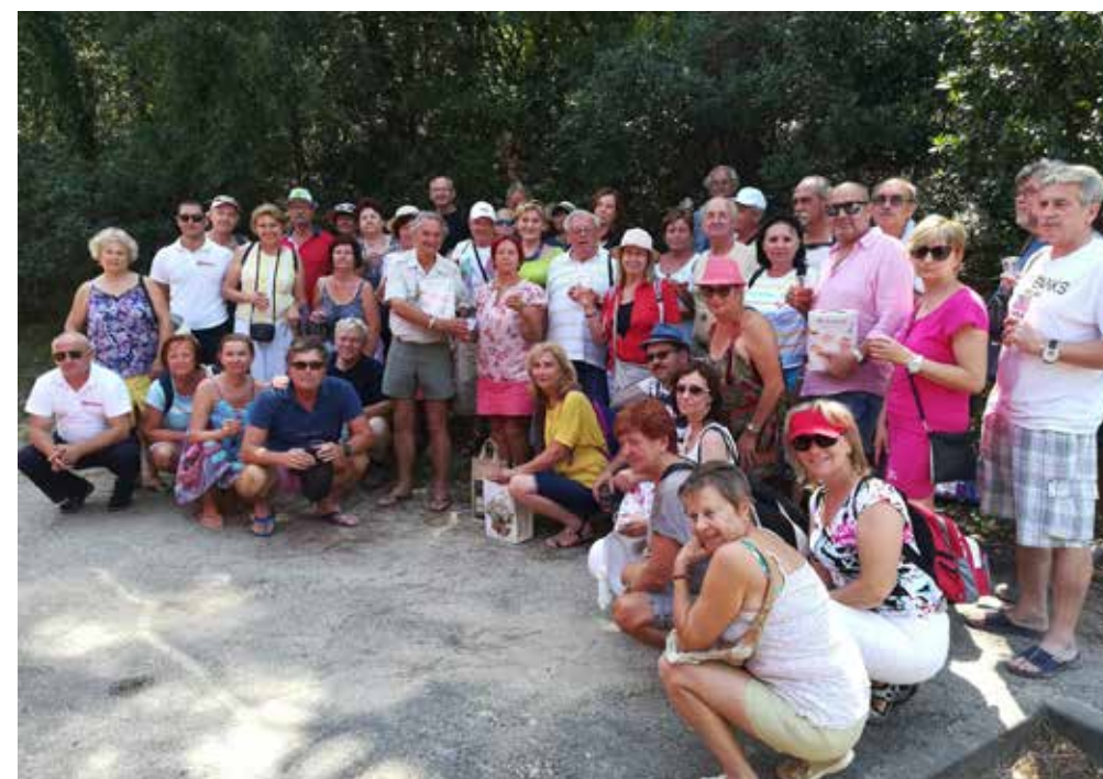
Dune du Pilat, le monument naturel de l'UNESCO