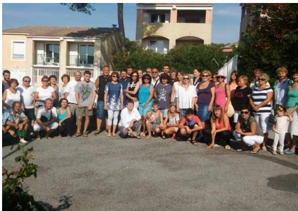
A la Côte d'Azur, à Villeneuve-Loubet