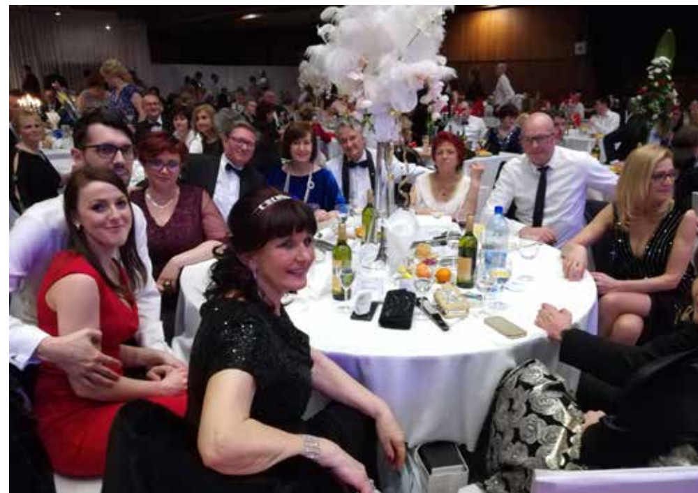
Notre dernier Grand bal