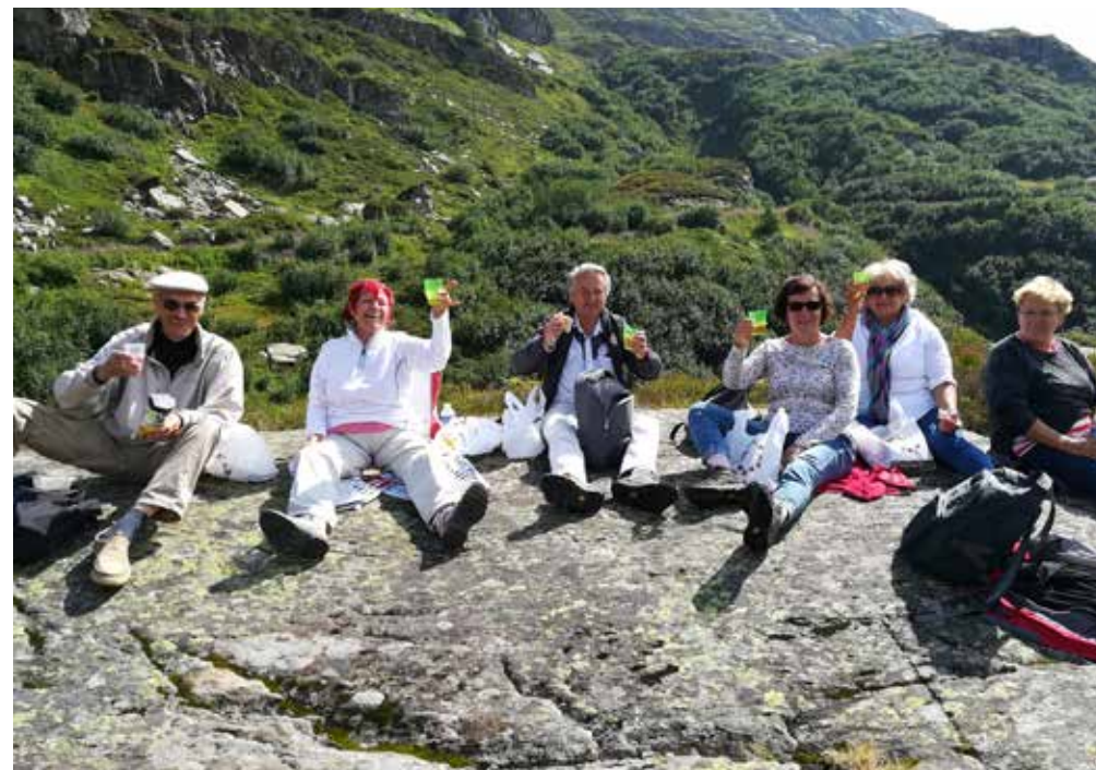
Le pique-nique à côté du barrage Emosson en Suisse