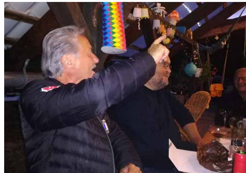
La chanson: Macejko, Macejko, ko-ko-ko-ko...