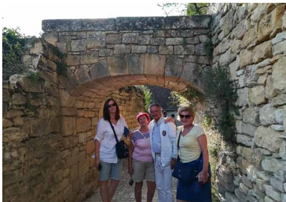
A Saint-Emilion près de Bordeaux