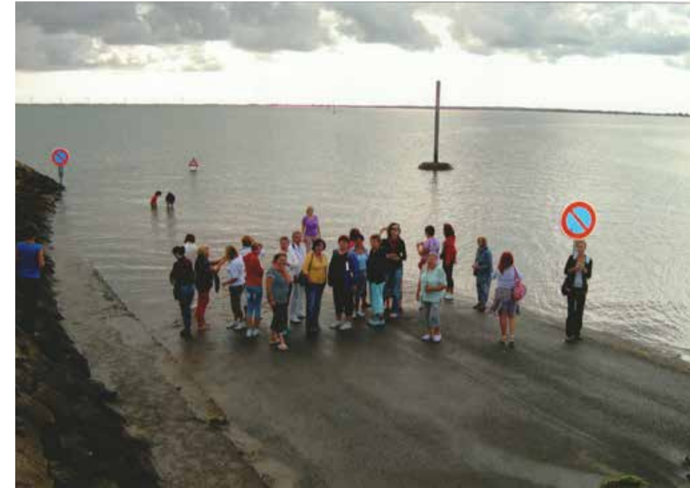
Passage de Gois, la route qui est plongée 2 fois par jour, elle va sur l'île de Noirmoutier