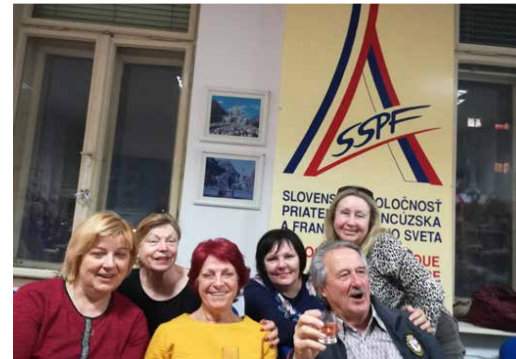
Sous le signe de notre association