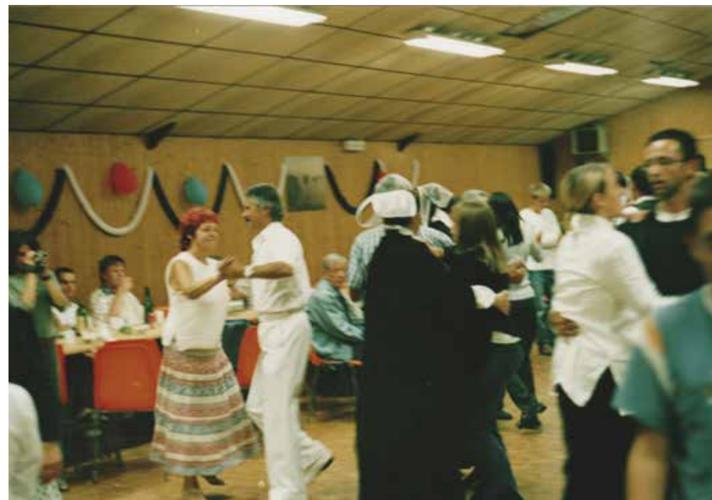
Soirée en Bretagne