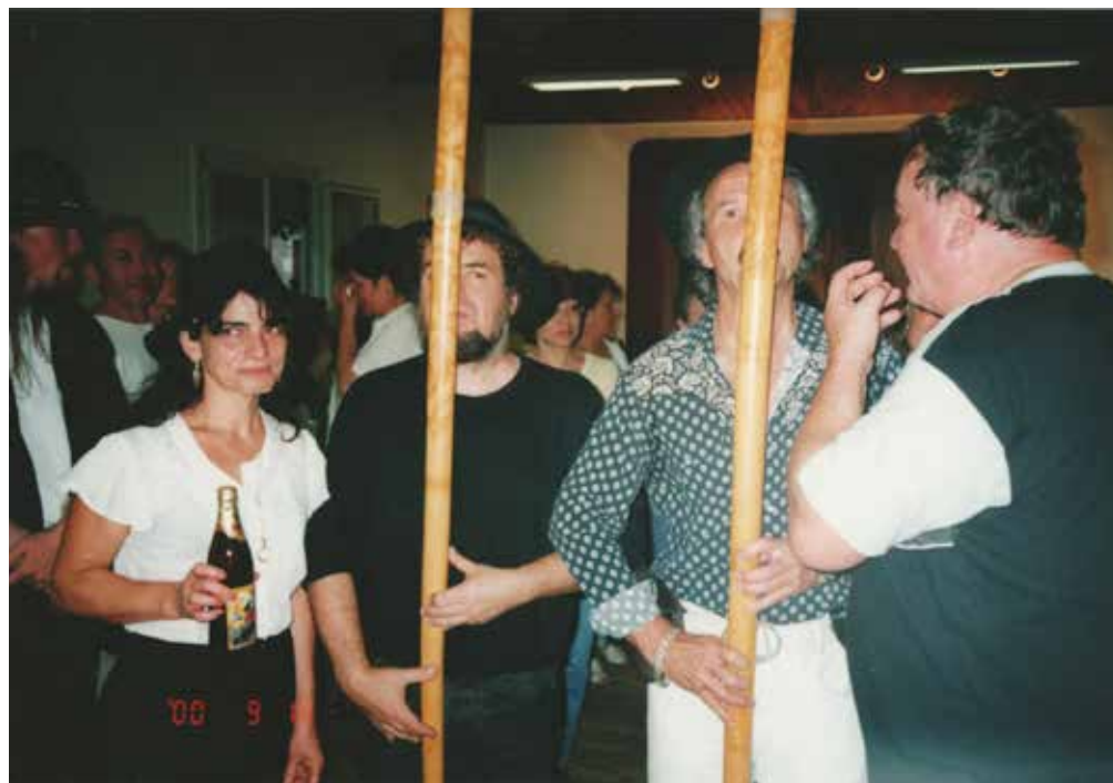
Explication de la fujara