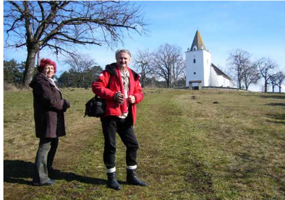
A Sádok, l'église du 12-ième siècle