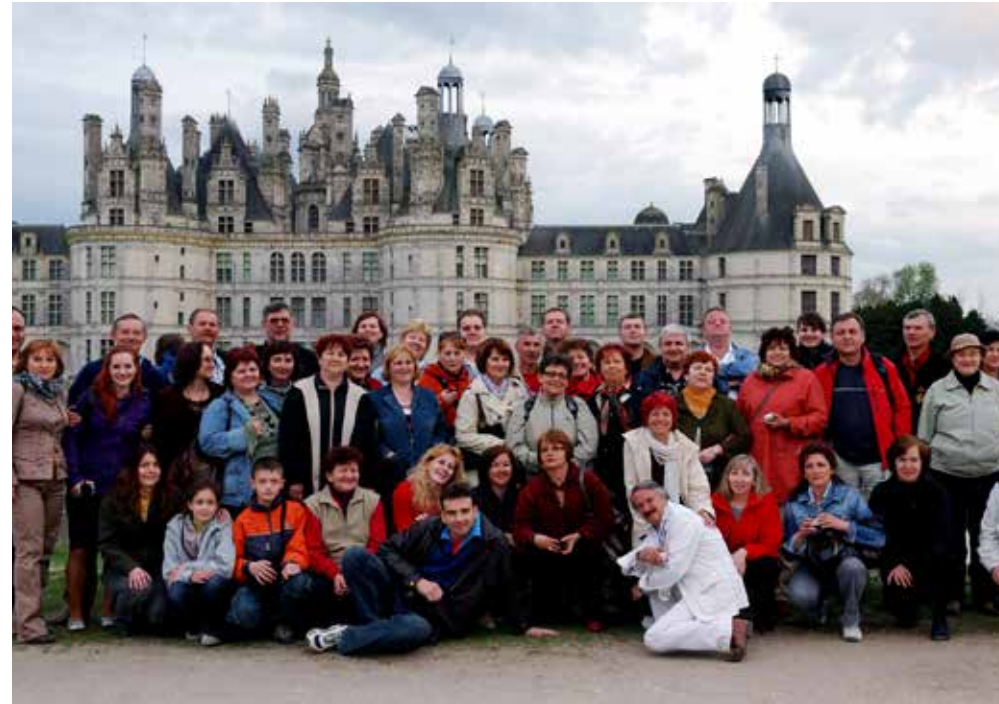
Devant le beau château de Chambord dans la vallée de la Loire