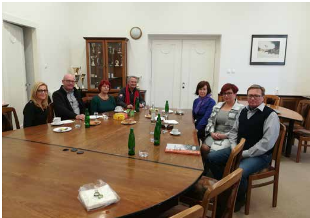
Chez Madame la maire à la mairie