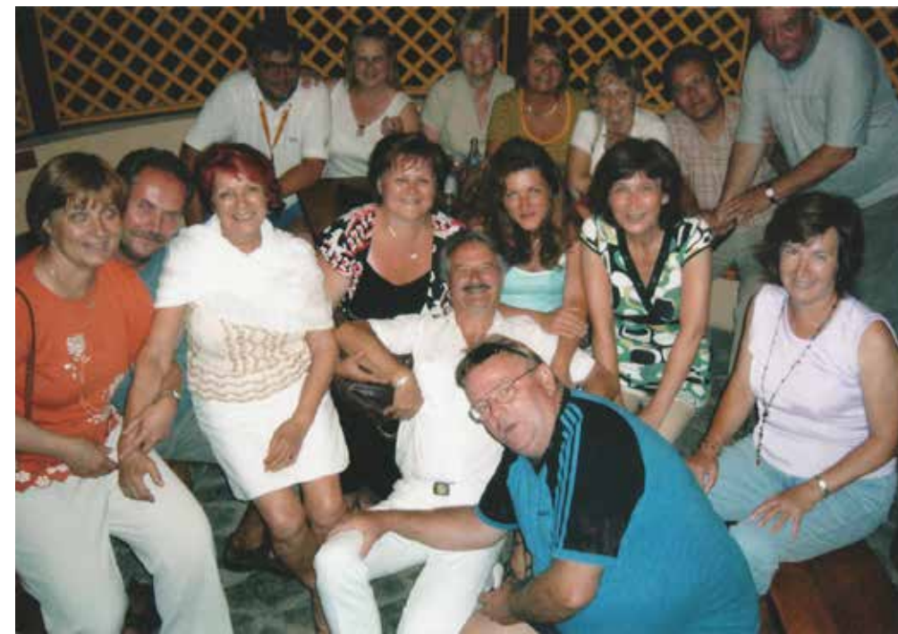
La soirée à Kostrín