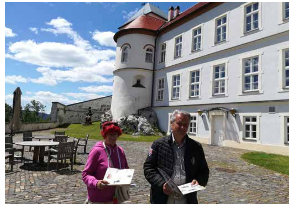
Chateau Partizánska Ľupča