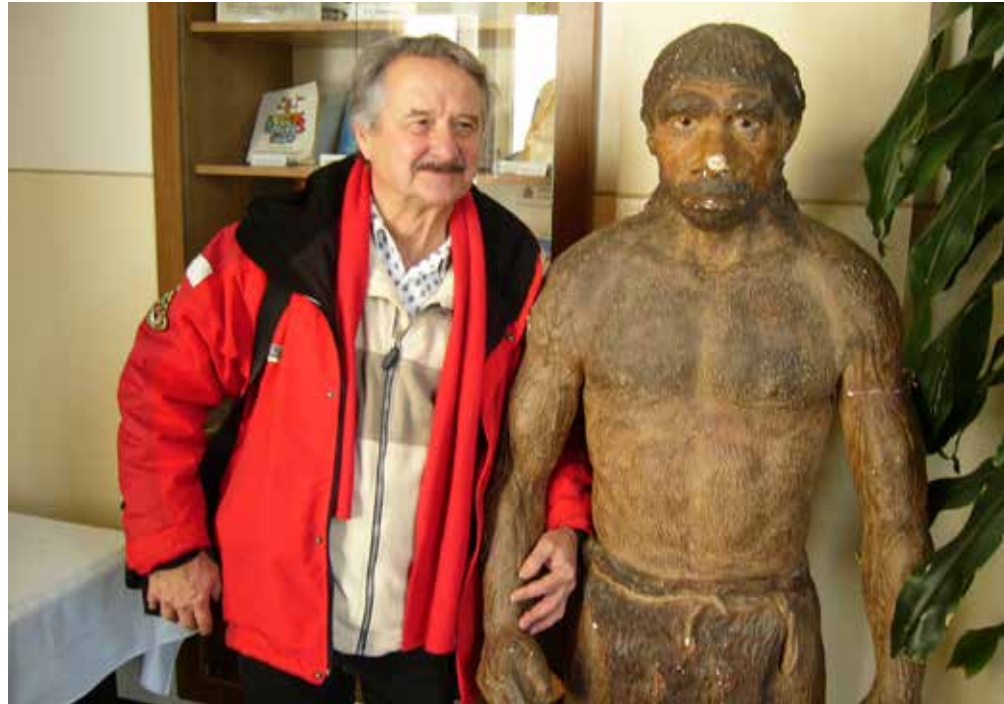
Au Musée de Trábeč à Topolčany