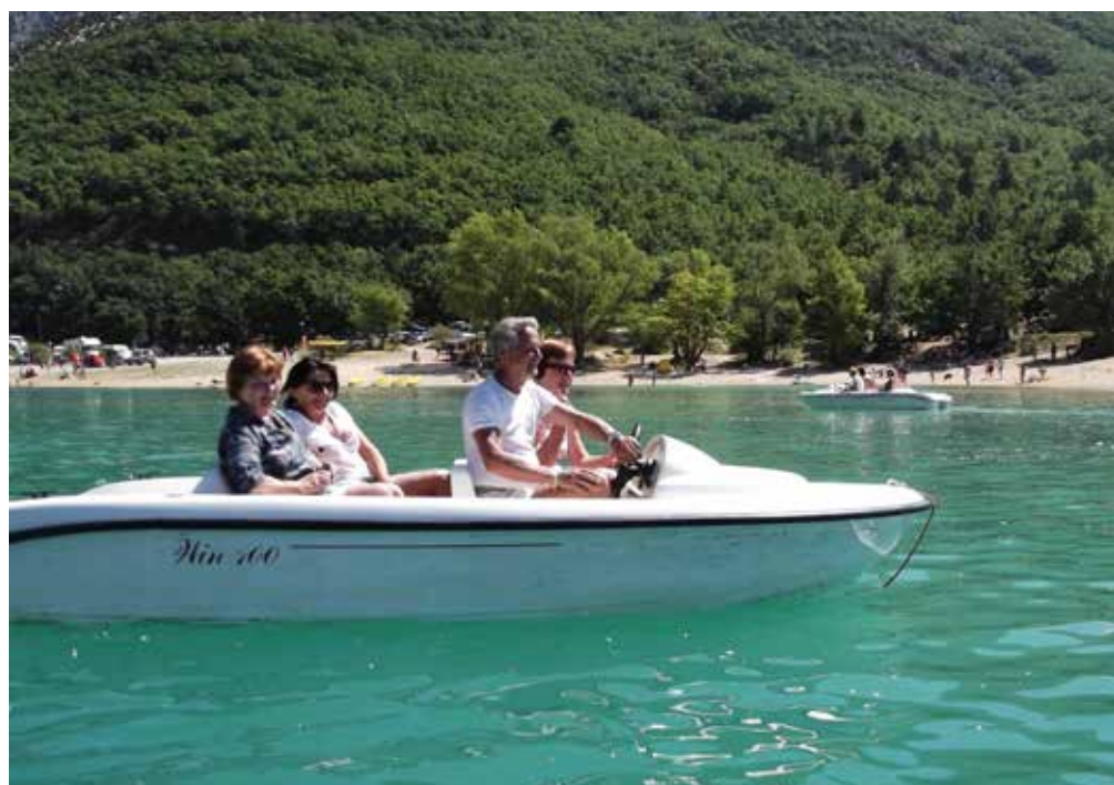
Grand Cagnon, le Lac de Croix